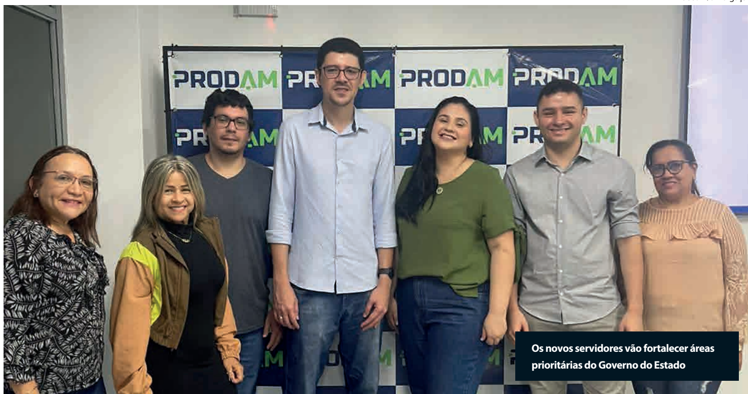
Os novos servidores vão fortalecer áreas prioritárias do Governo do Estado